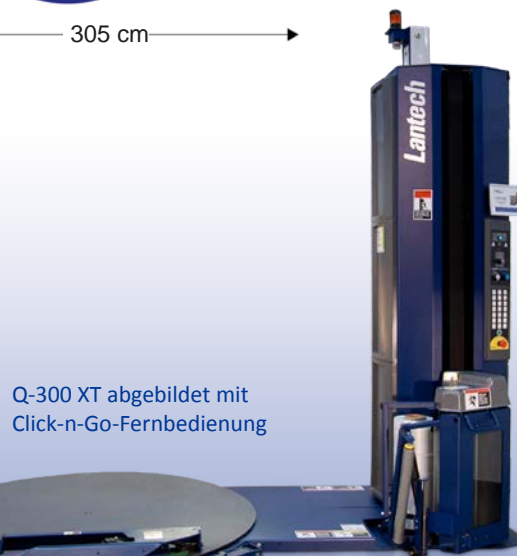
Q-300 XT abgebildet mit Click-n-Go-Fernbedienung