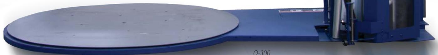
Q-300 *Abgebildet mit Pallet-Grip-Option.